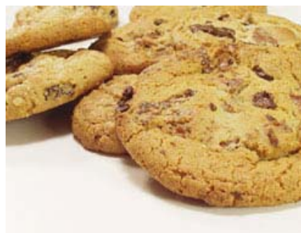
Hornear galletas será más fácil que nunca con estos consejos.

Hornear galletas en casa es una tarea divertida, deliciosa y sencilla, que llenará tu cocina de ese delicioso aroma a hogar. Aquí, algunos trucos para lograr galletas perfectas.